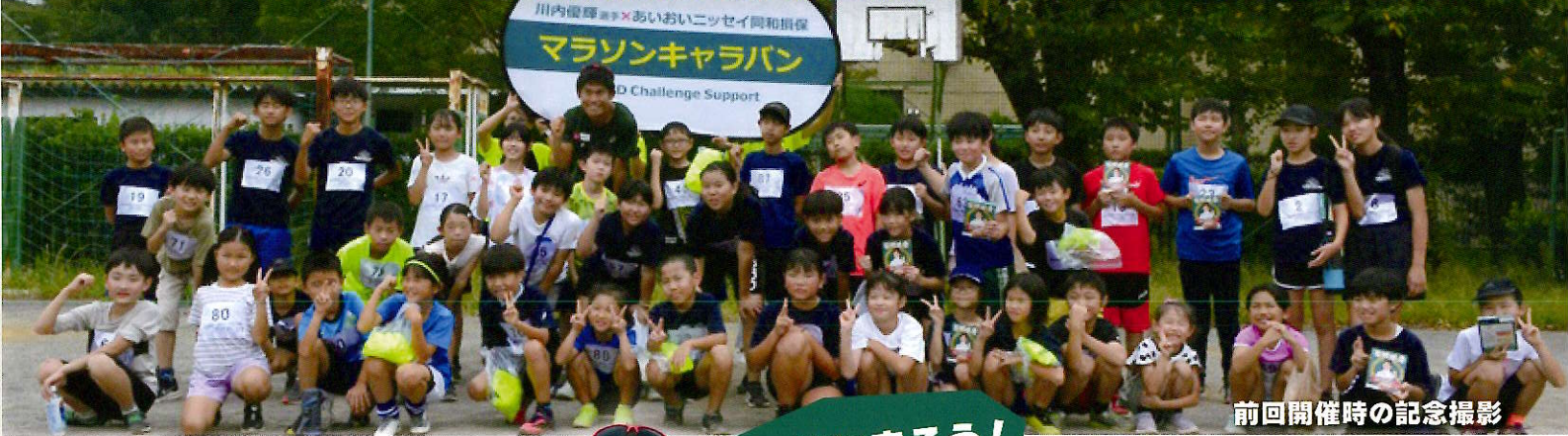
前回開催時の記念撮影